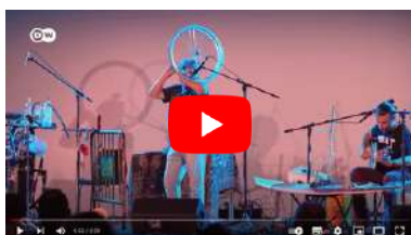
Video reportatge della TV tedesca EUROMAXX DW TV.(DE).