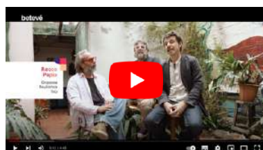
Video reportage della TV catalana BETEVÉ (CAT).