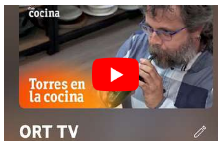
Musicisti ORT in TV, TEDx e WEB (13 videos).