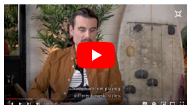
Interview and live set in "The WeeklyMag"- TV program (EN).