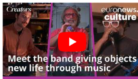
EURONEWS.Culture (ES subEN)