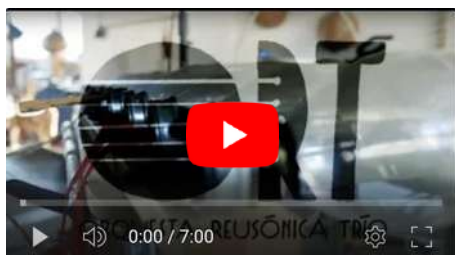
Video EPK 7 min.(ES sub EN). Teaser Video 1 min.(ES sub EN).