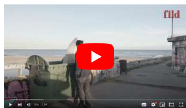
Video reportatge FILDMEDIA (FR).